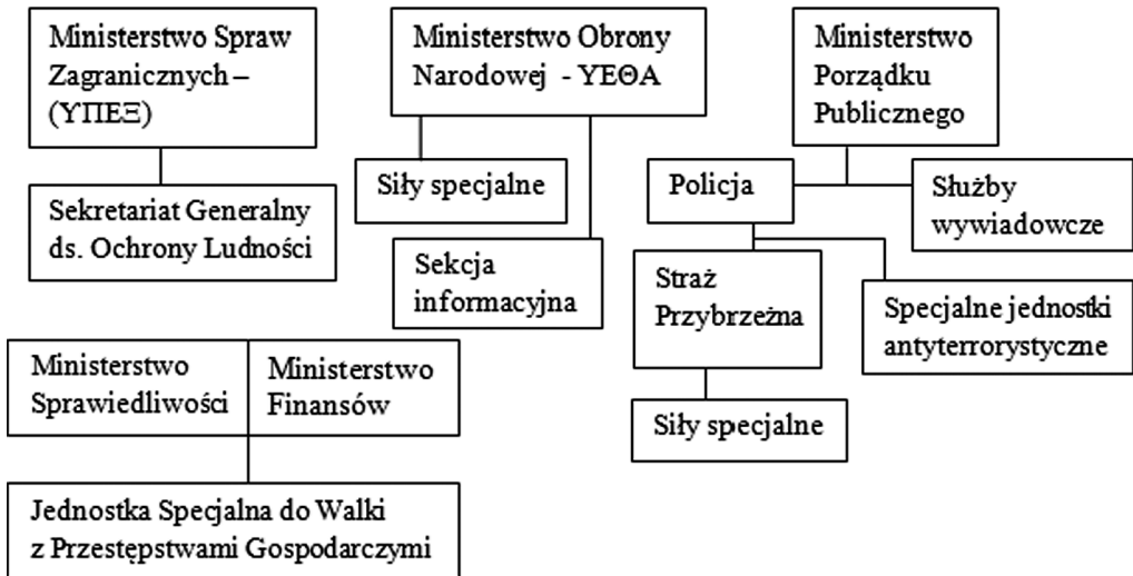
Rys. 2. Grecki mechanizm walki z zagrożeniami asymetrycznymi

We współczesnym świecie, w którym bezpieczeństwo nie jest już czysto militarnym aspektem, należy rozważyć, czy odpowiedzialność za nie powinno ponosić jedynie ministerstwa: Obrony, Spraw Wewnętrznych i Spraw Zagranicznych. W wielu przypadkach nie ma wyraźnej granicy pomiędzy zagrożeniami zewnętrznymi i wewnętrznymi państwa. Ochrona bezpieczeństwa narodowego wymaga teraz koordynacji i współpracy między resortami obrony narodowej i spraw zagranicznych z tzw. służbami wewnętrznymi, np. policją (usługi dla bezpieczeństwa, jednostki reagowania kryzysowego itp.). Istnieje więc potrzeba reformy krajowego mechanizmu, który gwarantowałby ścisłą współpracę i koordynację w celu budowania bezpieczeństwa narodowego w nowej sytuacji międzynarodowej.